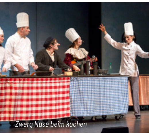
Zwerg Nase beim kochen