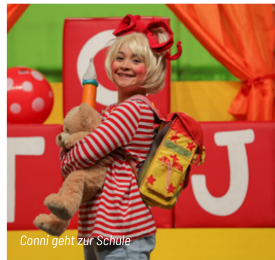
Conni geht zur Schule

Im Wald versammeln sich alle Tiere, um miteinander Karneval zu feiern. Hunderte von Vierbeinern, Vögeln und Fischen kommen